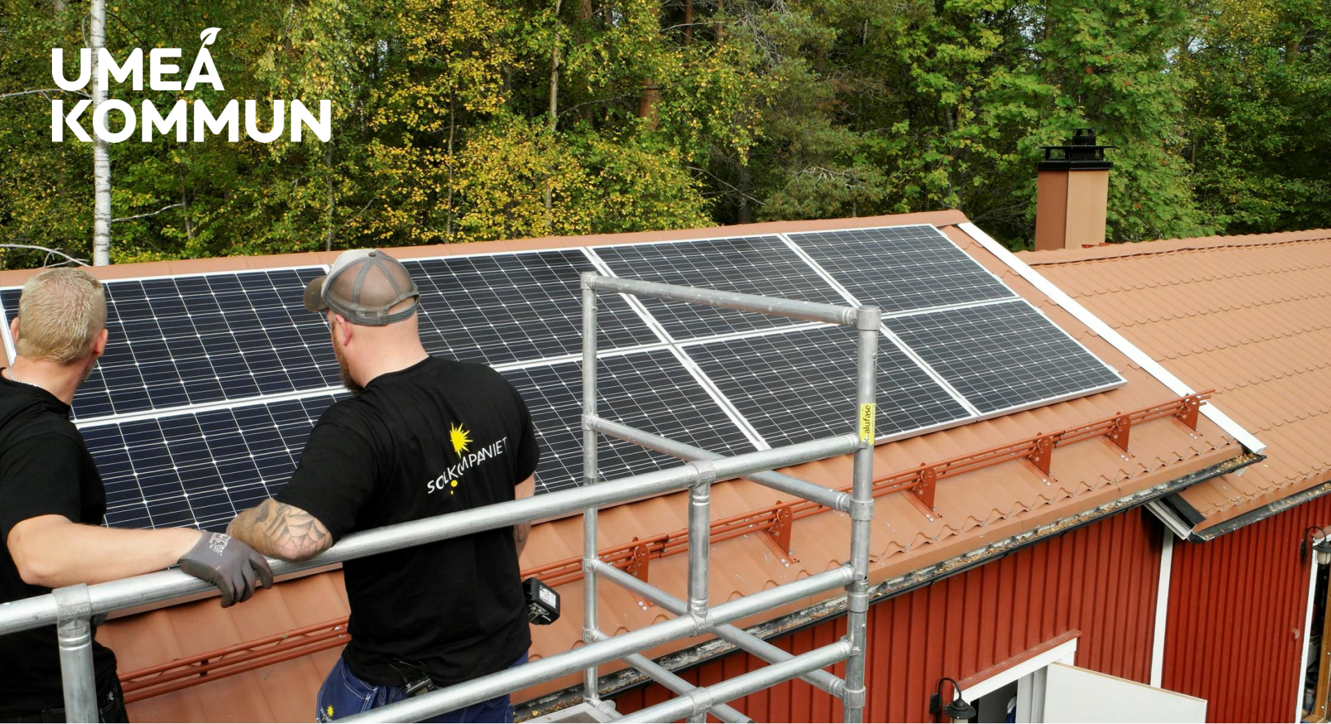
Foto: Solcellsinstallation i Täfteå

Solkartan är ett samverkansprojekt mellan Umeå kommun och Umeå energi med stöd från Länsstyrelsen i Västerbotten